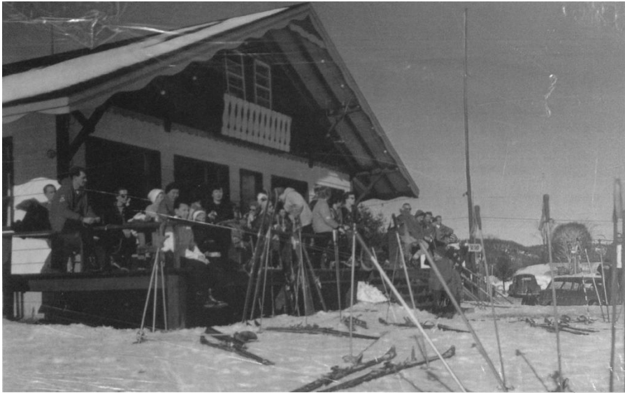
Mont Bellevue dans les années 60.